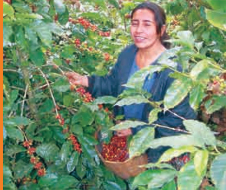
Cortadora de café

CECOCAFEN apoya la organización de las mujeres, esposas e hijas de los socios, en grupos de ahorro solidario para obtener ingresos complementarios a las actividades productivas del café.