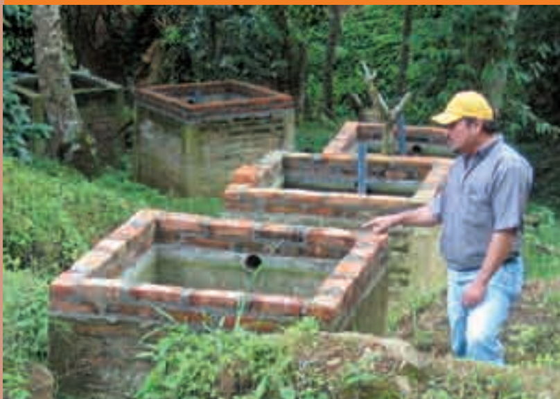
Manejo de aguas mieles

Tenemos relaciones de cooperación con: • LUTHERAN WORLD RELIEF. • INTERMON. • Ayuda Obrera Suiza, AOS. • CENTRO COOPERATIVO SUECO. Quienes nos apoyan para la producción, certificación, mejorar la calidad, fortalecer la institución, el turismo comunitario y la promoción de nuestro café.