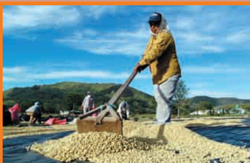
Secado de café

CECOCAFEN presta a las cooperativas asociadas a un 10% para el largo plazo, más 2% de comisión para cubrir gastos legales y administración del crédito, a un 14% para el corto plazo más 2% de comisión para cubrir gastos legales y administración del crédito. Las tasa son anuales sobre saldo.